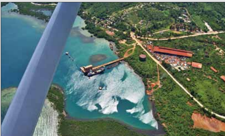
Reynolds Metals had a bauxite mine in Miragoâne for about 30 years

1944: Reynolds Haitian Mines, Inc., obtained an exclusive monopoly on bauxite and a concession to mine near Miragoâne. Over about 40 years, 13.3