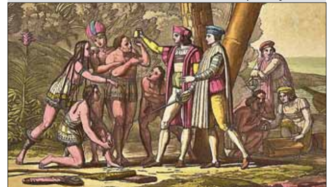
In his journals, Christopher Columbus waxed over the “pieces of gold as large as the hand” that he saw when he landed in what is now Haiti.

1492: Writing in his journal during his first voyage, Christopher Columbus said the people of what would later be called