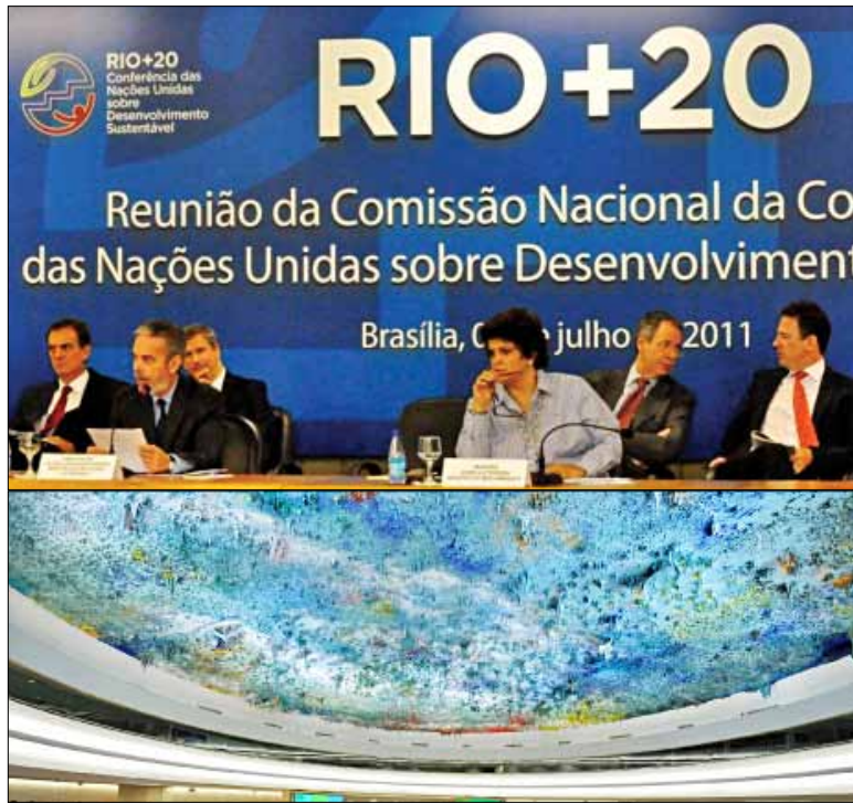
Le sommet de (Rio 92) a été le début et le plus important viendra ensuite, (RIO+20) car on a déjà commencé à penser au développement et à l'environnement comme une unité indivisible

Nul n'ignore que la décennie qui vient de s'écouler a été la plus chaude des cent dernières années que l'on ait connues. Ce phénomène de réchauffement global, conséquence de ce que