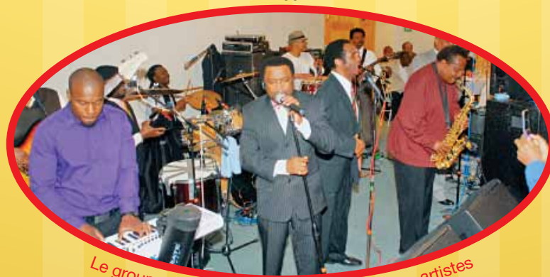
Le groupe musical Rétro Band - Et d'autres artistes

5 ans de lutte * 5 ans de courage * 5 ans de résistance Ce sera la fête du Patriotisme, de la Liberté et de la Solidarité Une fête à vivre et à revivre en l'honneur de Charlemagne Peralte Avec