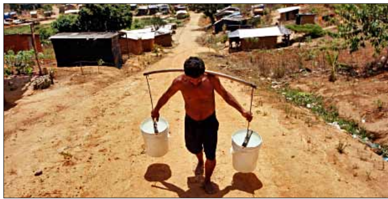
Au sein de la population latino-américaine 90 millions de personnes manquent d'eau potable alors que 140 millions ne disposent pas des services d'égouts

l'on appelle l'effet de serre, a de graves conséquences écologiques, économiques et sociales.