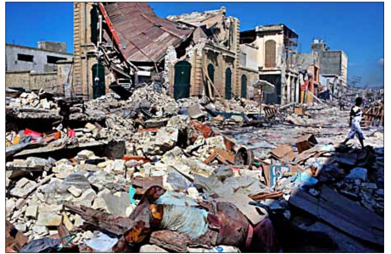
Les désastres qui ont eu lieu au Chili, en Colombie, en équateur, au Pérou et en Haïti sont donc un avertissement

Très inquiétante est, par ailleurs, la perte de la diversité biologique associée à ces processus. La pollution des océans, des mers et des zones côtières, ainsi que le danger auquel sont exposées les ressources vivantes se trouvant dans ces régions, constituent un autre grave problème. Le phénomène universel de désertification, l'expansion des frontières agricoles et