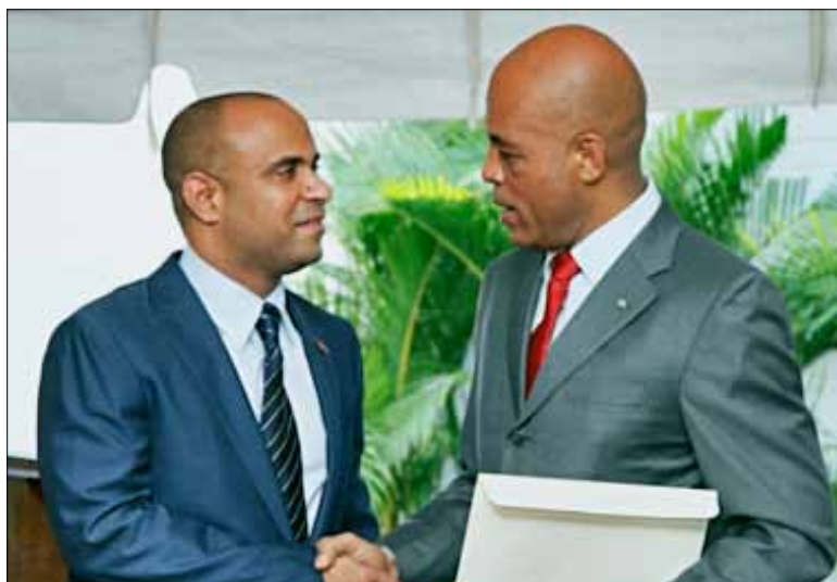
Laurent Lamothe depuis son installation ne cesse d'annoncer la publication de l'amendement de la constitution haïtienne de 1987. Toutefois, il reconnaît que cette prérogative revient au président de la République