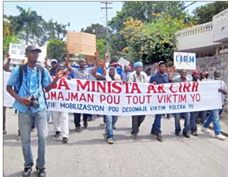
Divès òganizasyon politik, sendikal ak popilè nan divès peyi sou latè ap òganize yon seri mobilizasyon pou di non kont MINISTA, kont CIRH, kont Bill Clinton, kont FMI ak Bank Mondyal, kont piyaj min lò nou yo

Vendredi premye jen k ap vini la a ap fè 8 lane depi MINISTA ap taye banda nan peyi a. Lè MINISTA te debake, Nasyonzi te di nou fòs sa a la pou li tabli establi nan peyi a. Yon peyi ki pat janm nan lagè ak okenn peyi sou latè. Anpil moun ki gen enterè nan fòs okipasyon an te vle fè popilasyon an kwè nan pawòl te kowosòl sa a. Men, jan pwovèb la di li, twou manti pa fon. Menm si w abiye yon bourik ak kostim jouk ou fè l sanble ak moun, kou l midi, l ap ranni, l ap ponpe kanmenm pou fè tout moun konnen se bourik li ye.