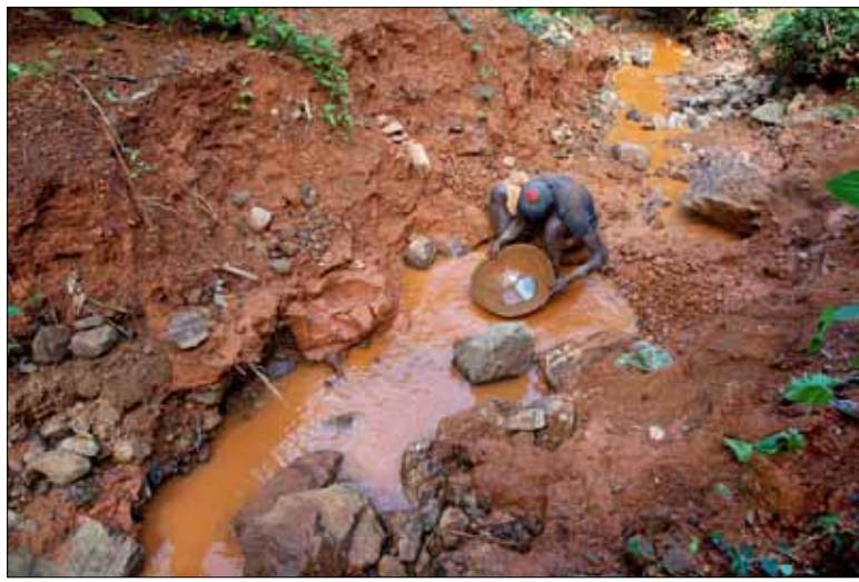
Un homme en train de chercher de l'or

Pas d'après Anglade. « Pour rien au monde je n'enlèverais ces articles », dit-il.