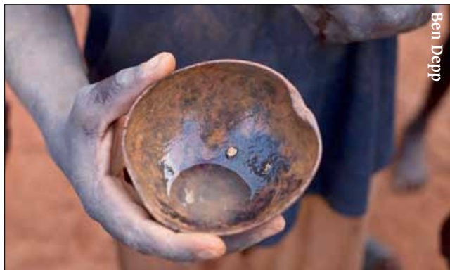
A Haitian man displays a small piece of gold he found prospecting. People in Haiti’s northern villages have been digging for gold since the 1960s. With gold prices at record highs, more Haitians, and foreign mining companies, are digging for Haiti’s gold

Finance Minister (2009-2011, prior to that he was Director General of the ministry), who oversaw negotiations with Eurasian while serving in the powerful position. “The government is conscious of what damage they are doing to the company. They have camps all over the country, with important logistics, and they are blocked because the convention can’t be signed.”