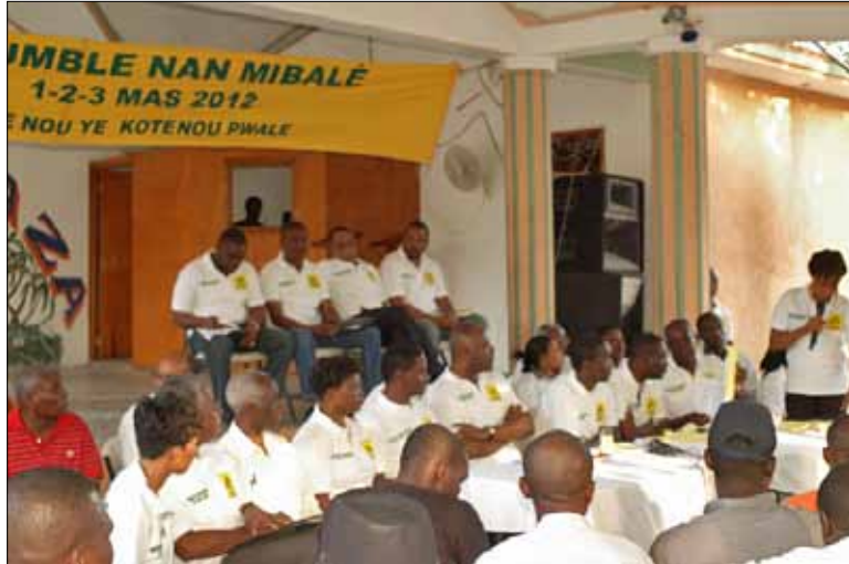
« Woumble » de la plateforme Inite à Mirebalais au début du mois de mars 2012

ont tout simplement cessé de participer aux réunions et activités de la plateforme ; ils ont interrompu toutes les relations avec le Comité exécutif et pris sur des questions politiques de la plus grande importance, des positions contraires aux orientations et aux décisions dégagées par les instances supérieures de la plateforme. Il est évident que ces membres portent délibérément atteinte aux intérêts fondamentaux de l'organisation.