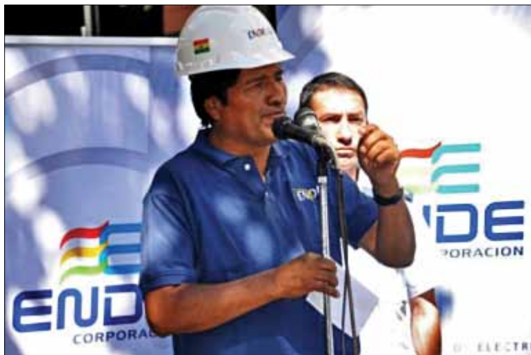
Le président bolivien Evo Morales en train de faire un discours juste après avoir nationalisé la compagnie d'électricité espagnole Transportadora de Electricidad SA, Cochabamba, le 1er mai 2012

Le gouvernement d'Evo Morales a entrepris de répondre aux demandes des Boliviens d'avoir un pays plus juste et souverain, visant au bien-être de tous et non pas de celui de quelques-uns. Pour cela, lors de son entrée en fonctions, Evo Morales a proclamé le 1er mai 2006 un décret ayant pour but de lancer un processus de nationalisation des en-