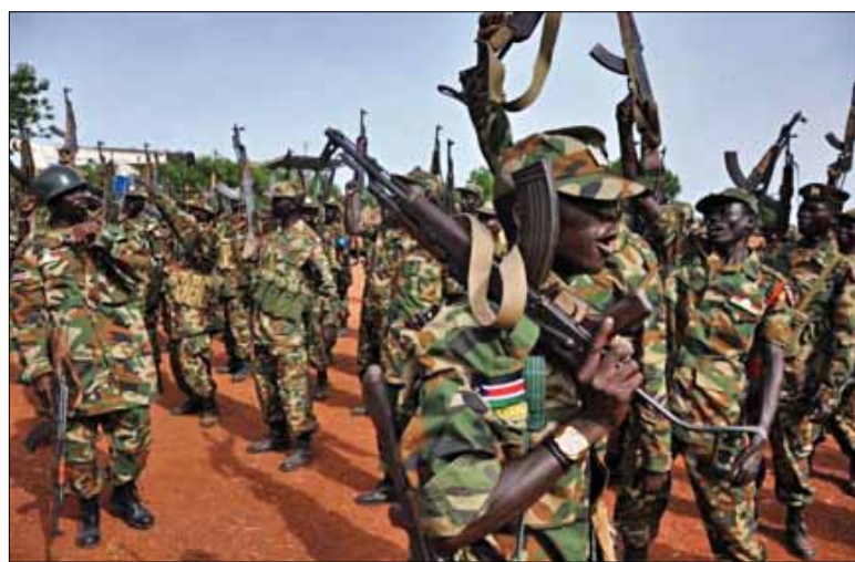
En l'espace des quelques mois qui ont suivi sa sécession et son indépendance, le Soudan du Sud s'est mis au bord d'une autre guerre destructrice avec son voisin du Nord

Le CPA a fourni un mécanisme qui ouvrait la possibilité d'auto-détermination pour la population du Sud au terme d'une période de six ans ; le but de cette période intérimaire était d'accorder une chance à Khartoum pour rendre la préservation de l'unité